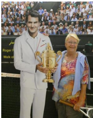
und ein Interview mit RF

ten Räumen wurde uns in kleineren Filmabschnitten auf amüsante Weise und aus Sicht einer Kaffeebohne der Weg vom Reifen der Bohne bis zum Genuss des Kaffees erklärt.