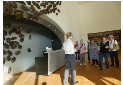
dann geht's hinein in die Kaffeemaschine...

Weiter ging die Fahrt nach Sempach zur Straussenfarm. Nach einem hervorragenden Mittagessen und grossem Dessertbuffet durften wir bei einer Führung viel über die Zucht von Vogel Strauss erfahren. Die vielen Fragen unserer Mitglieder wurden kompetent beantwortet und der Jöö-Effekt bei den ganz klei-