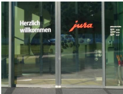
bei den Kaffeebohnen im JURAworld

Der diesjährige Herbstausflug fand am letzten Donnerstag wiederum bei strahlendem Sonnenschein statt. Via Egerkingen fuhren wir nach Niederbuchsitten zur JURAworld. Zuerst stärkten wir uns mit einem Gipfeli und einem feinen Kaffee, der keine Wünsche offen liess. In verschiedenen raffiniert gestalte-