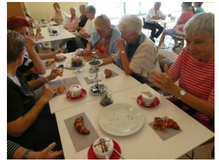
gibt's erst mal einen Kaffee

Der diesjährige Herbstausflug fand am letzten Donnerstag wiederum bei strahlendem Sonnenschein statt. Via Egerkingen fuhren wir nach Niederbuchsitten zur JURAworld. Zuerst stärkten wir uns mit einem Gipfeli und einem feinen Kaffee, der keine Wünsche offen liess. In verschiedenen raffiniert gestalte-