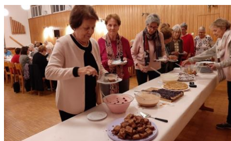
das traditionelle Dessertbuffet

nicht fehlen. Ein ganz herzliches Dankeschön geht an alle Mitglieder für ihr Kommen und den vielen Helferinnen, ohne die ein solch gemütlicher Anlass nicht durchführbar wäre.