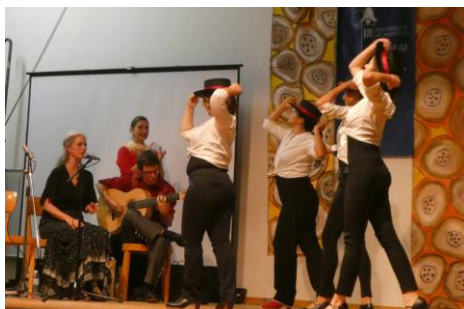
mit viel Rasse

So kündigte Maja die Flamenco-Tanzgruppe Chispa aus Basel