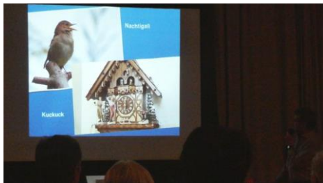
Toni Lerch's Geschichten über einheimische Vögel